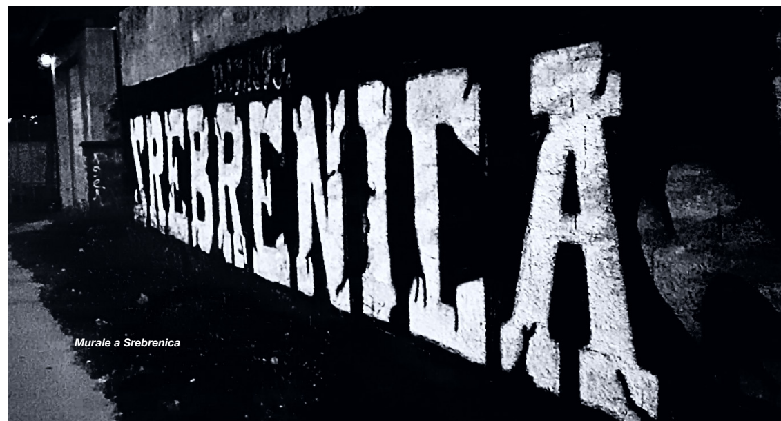
Murale a Srebrenica

Tenere uniti il ricordo e la convivenza è una tensione che non si risolve: si può solo attraversare.