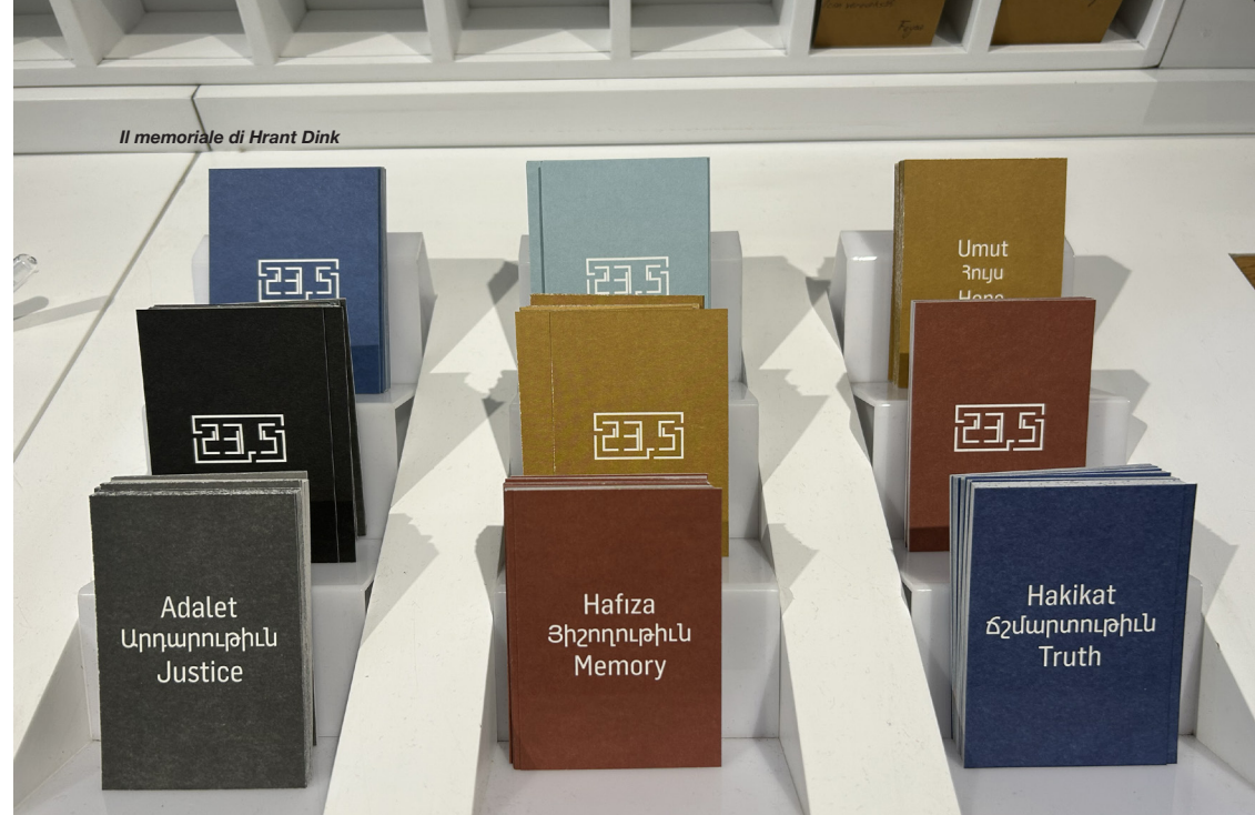
Il memoriale di Hrant Dink

La loro presenza è una garanzia per il futuro: restare