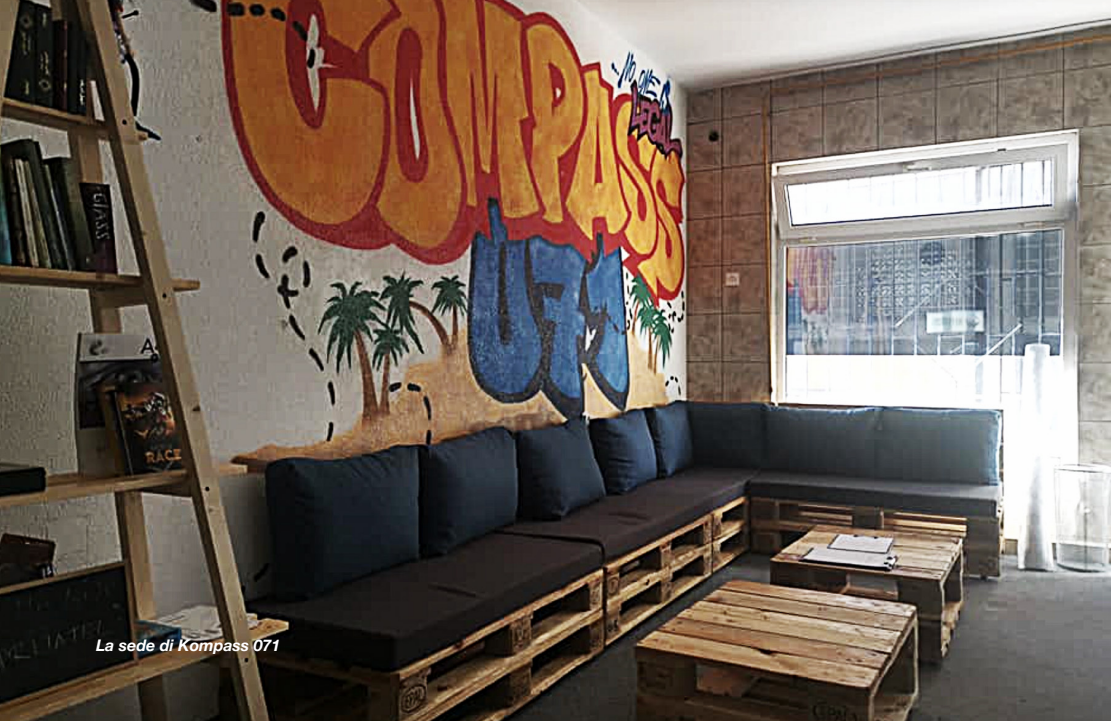
La sede di Kompass 071

In città incontriamo anche Kompass 071 . Gestiscono un centro diurno che offre servizi essenziali: docce, abiti, pasti, supporto legale. Ciò che colpisce è l'atmosfera vitale che si respira nonostante la pressione costante.