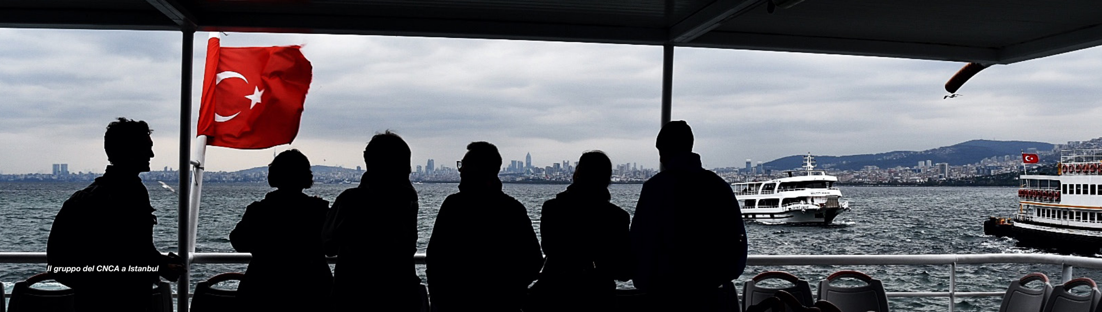
Il gruppo del CNCA a Istanbul