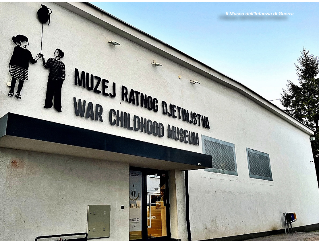
Il Museo dell'infanzia di Guerra

Le persone arrivano, sostano, ripartono; i volumi sono alti e le risorse limitate. La sfida più logorante è la continuità: la cronica mancanza di volontari a lungo termine che possano sostenere il peso di questa marea umana.