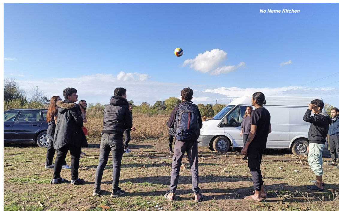
No Name Kitchen

E costringe chi passa a vivere in una sospensione continua, in un limbo dove il tempo sembra aver perso ogni direzione .