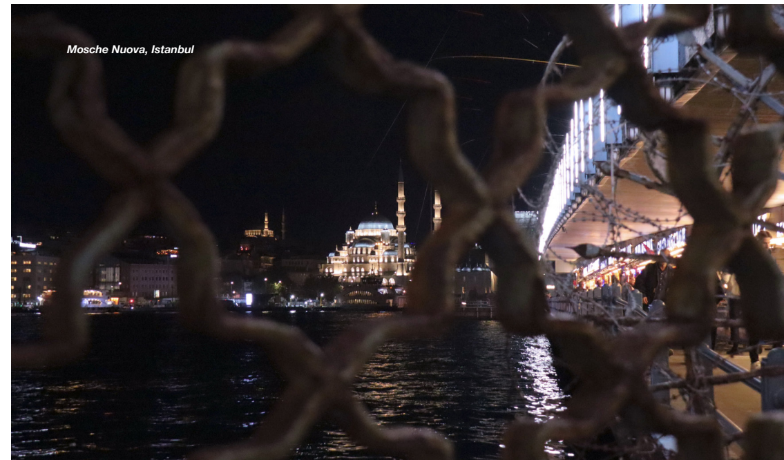
Mosche Nuova, Istanbul

A Istanbul hanno il volto delle piazze contese, delle case che resistono alle demolizioni, delle chiese silenziose e dei caffè dove la poesia si mescola alla politica per restituire voce a chi è stato messo a tacere. Sono i volti che rifiutano la resa. E ogni volto, in questa geografia della resistenza, è un edificio che non crolla.