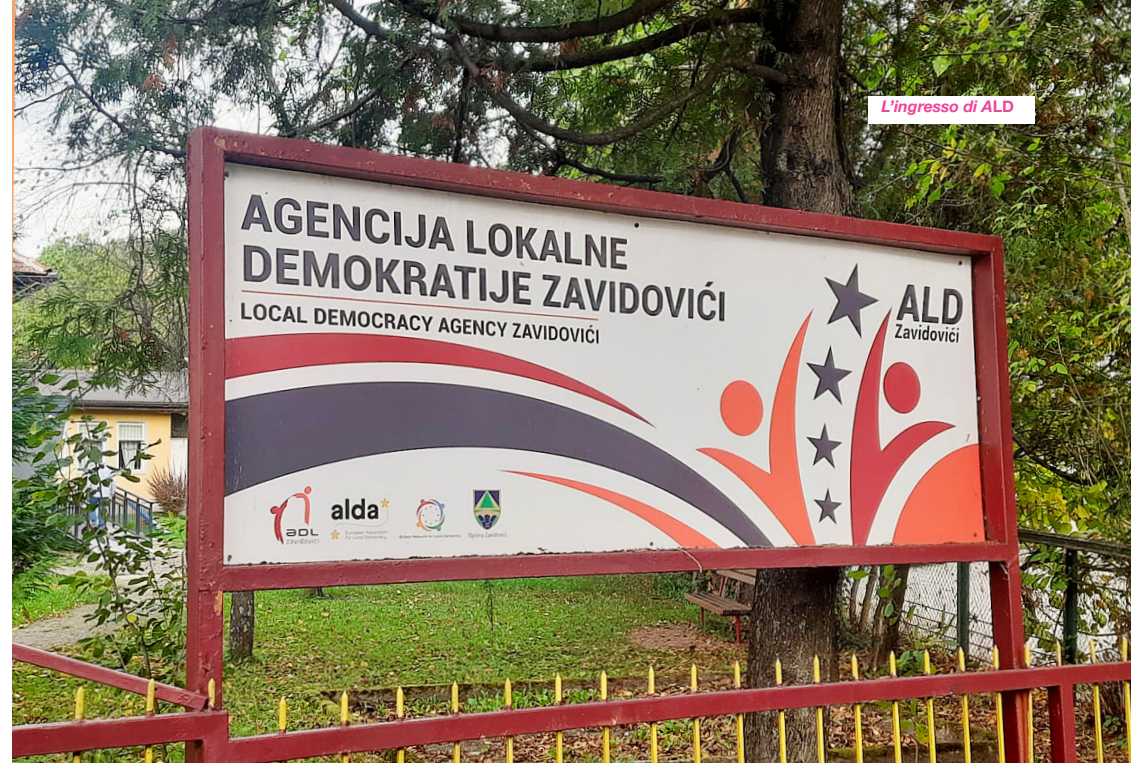
L'ingresso di ALD

In un contesto ancora profondamente segnato dalle fratture del passato, la continuità diventa, di per sé, una forma di resistenza . Perché in una terra di partenze e di strappi, restare non è un'inerzia, ma una scelta politica e umana.