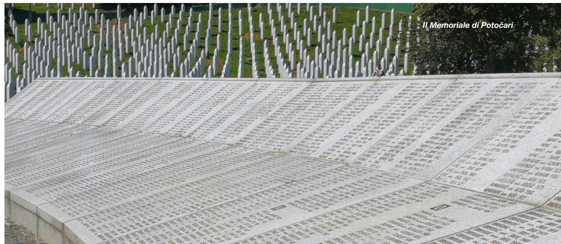
Il Memoriale di Potočari

La nostra guida è un ragazzo nato nel 1995. Racconta ciò che non ha vissuto direttamente, ma che definisce ogni istante della sua esistenza. A un certo punto pronuncia parole che vibrano come una sentenza: «Abbiamo offerto la riconciliazione e non cerchiamo la vendetta perché sappiamo cos'è la sofferenza».