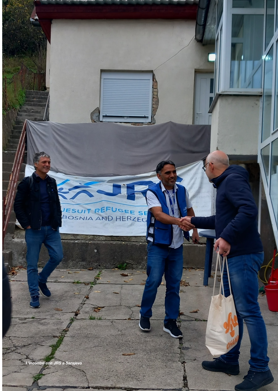
L'incontro con JRS a Sarajevo

È esattamente l'opposto del sistema-confine descritto nel primo movimento: il confine seleziona e astrae, habibi nomina e avvicina .