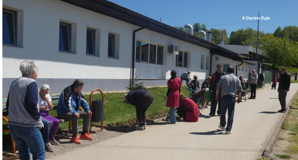
Il Centro Duje

L'impegno di Emmaus travalica le mura del centro. A Srebrenica seguono un progetto dedicato alle madri rimaste sole dopo il genocidio . Un'équipe le visita quotidianamente, portando assistenza medica e, soprattutto, presenza. Molte di queste donne hanno perso tutto; in questo scenario, la cura non ha il potere di risolvere il passato, può solo scegliere di restare.