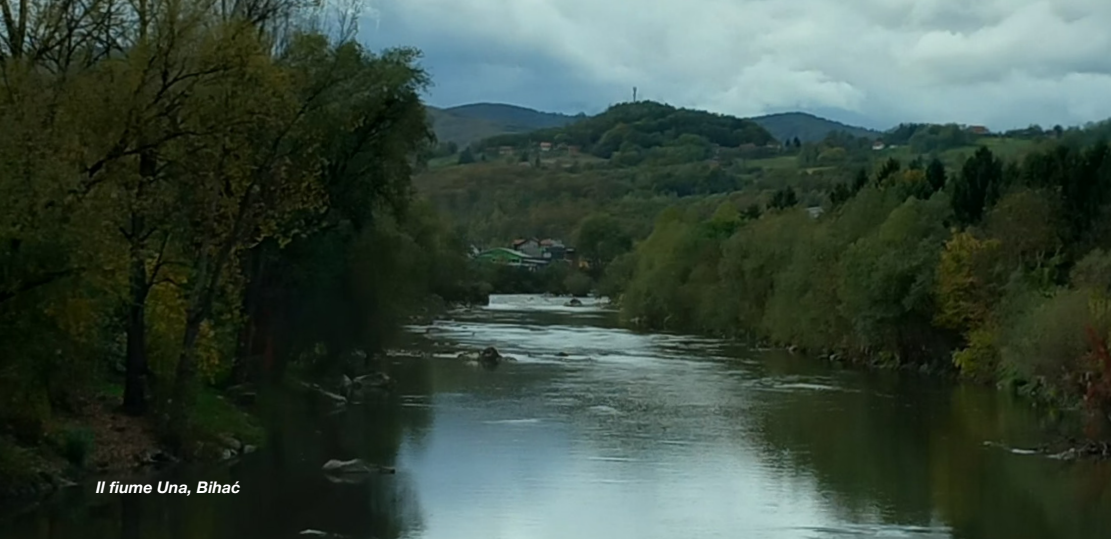
Il fiume Una, Bihać