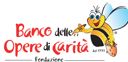
Fondazione Banco delle Opere di Carità Onlus