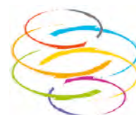
Umanità Nuova - Movimento dei Focolari