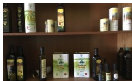
STAVROS NIKOLOPOULOS PRODUTTORE - ESPORTATORE