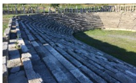
MESSINI ANTICA ANFITEATRO