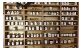
BANCA DEL SEME RE THINK - KALAMATA