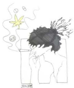
Disegno a cura di un utente Spazio Blu

Il presente convegno intende affrontare la complessità di tali temi, per i quali si rende necessario sia l'approfondimento clinico e pedagogico sia il confronto diretto tra servizi di differenti ambiti territoriali che hanno sviluppato significative competenze negli interventi con i giovani. La riflessione teorica e scientifica è in tal senso orientata a favorire l'individuazione di modelli efficaci e replicabili che possano orientare nella ricerca delle risposte più adeguate ad un problema che costituisce motivo di allarme sociale, sanitario ed educativo.